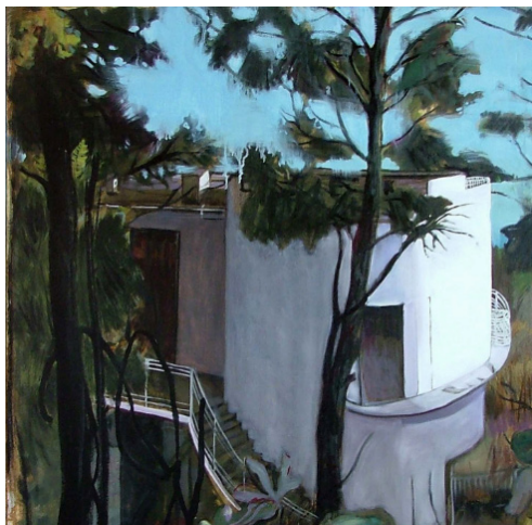
Paysage 44, huile sur toile, 123 x 123 cm, 2007 Collection Privée