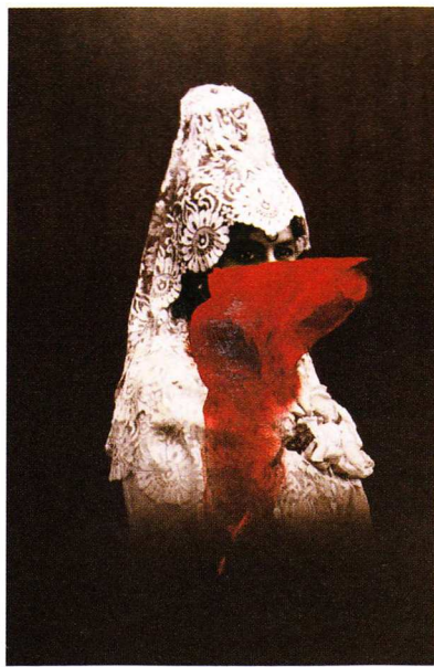
Carmen Calvo. L'Espagnole . 2002, technique mixte, peinture, photographie, 125 x 80 cm. Collection du Conseil Général du Var.