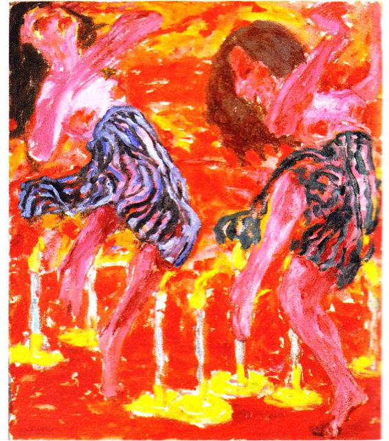
Emil Nolde. Kerzentanznerinnen (Danseuses aux bougies) . 1912, huile sur toile, 101 x 87 cm. Neukirchen, Stiftung Seebüll Ada und Emil Nolde.