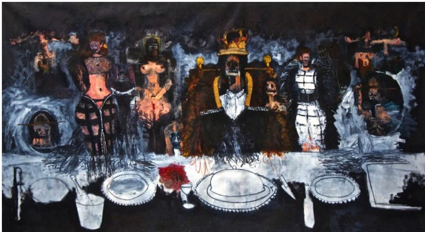
Pierre Aghaikian, Mastermind , 2015 Huile sur toile, 178 x 327 cm

“Je veux qu’elle soit indépendante, forte, liée à ma culture. Tout ce qui m’est intime s’inscrit dans ma peinture...”