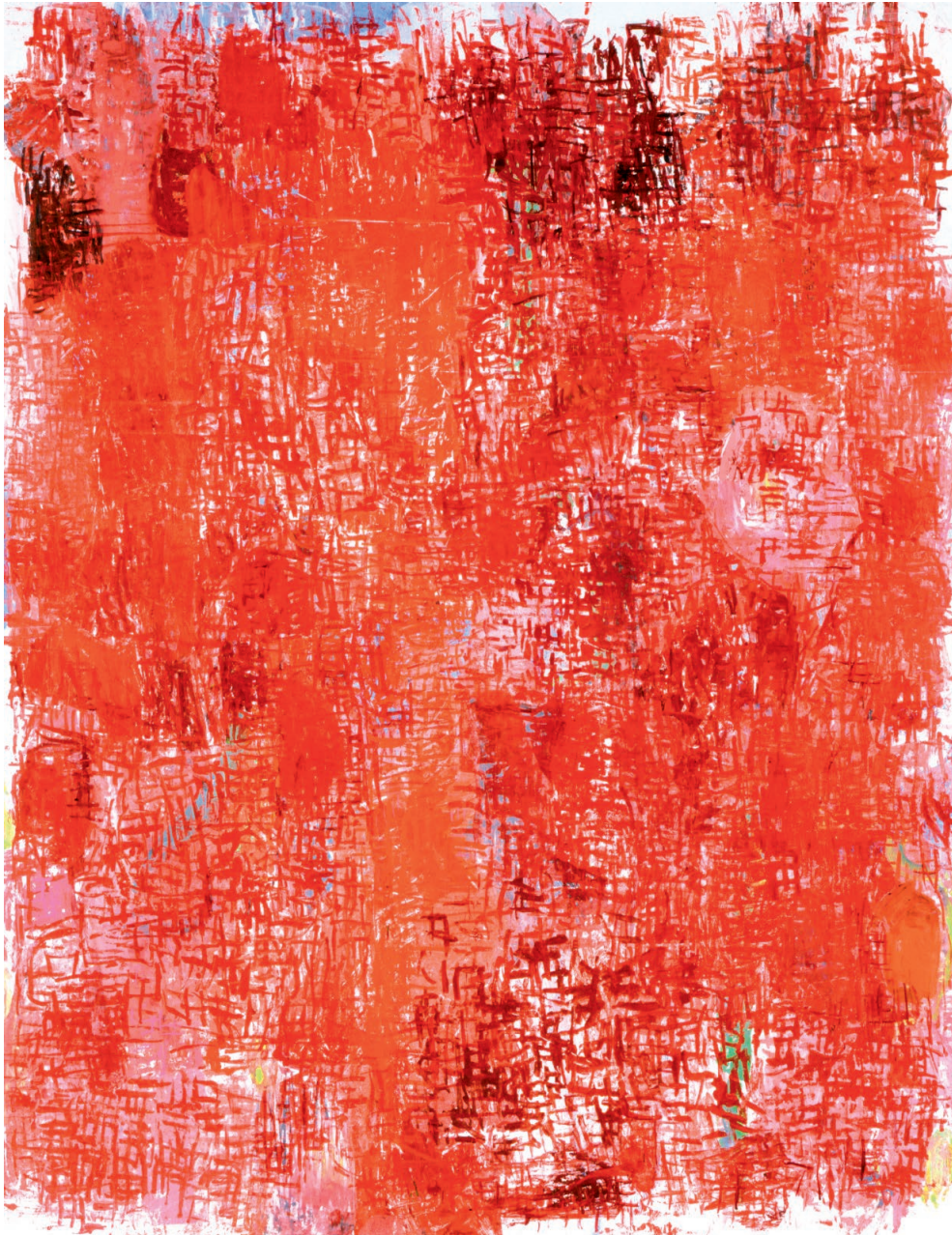
Michaële-Andréa Schatt, Robe (rouge) , 1999/2000 Technique mixte sur toile, 240 x 185 cm

“Déploiement - tissage, apparition - sédimentation, retournement-pli, métissage... La peinture nous invite en silence à l'expérience de la pluralité...”