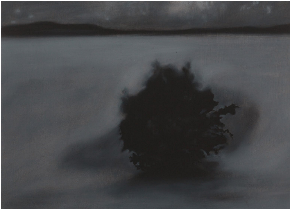
Aurore Pallet, Les annonces fossiles 6 , 2014 Huile sur médium, 17 x 25 cm

“Il faudrait ne pas pouvoir dire : « La Peinture, c’est... ». Pour moi la peinture n’a pas de majuscule, elle n’est pas une idée. Elle est un moyen que j’utilise pour sa matière et son temps. La surface lisse des panneaux de bois, la superposition méticuleuse des glacis créent un espace d’intervalle entre nous et le fond irrationnel que porte l’obscurité de ces paysages mentaux.”