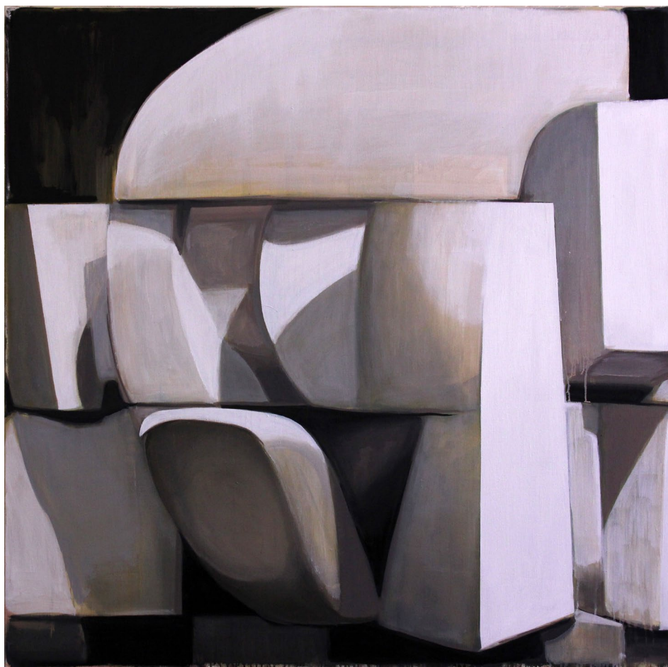
Jérémie Liron, Paysage 128 , 2014 Huile sur toile, 128 x 128 cm

“Voir, c’est voir le regard lui-même à travers lequel tout regard se projette et par lequel il nous revient. On ne peint pas la chose, écrit Mallarmé, mais l’effet qu’elle produit, l’espace de la relation.