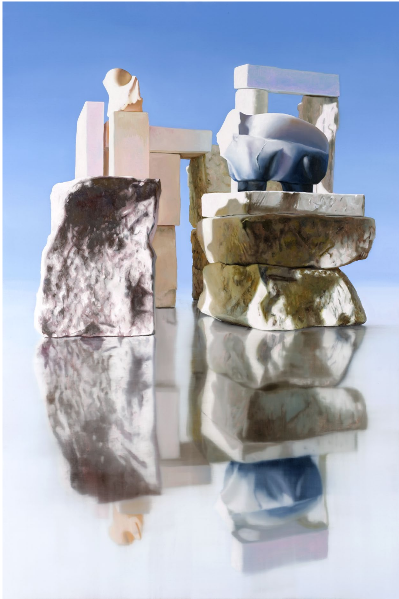
Maude Maris, Solar , 2015 Huile sur toile, 190 x 130 cm

“Lorsque mes petits moulages deviennent sujets de mes tableaux ils perdent une dimension, mais par ce passage, la brindille devient tronc et la figurine rejoue l'antique. La peinture rend possible une image à la fois ouverte, énigmatique et incarnée.”