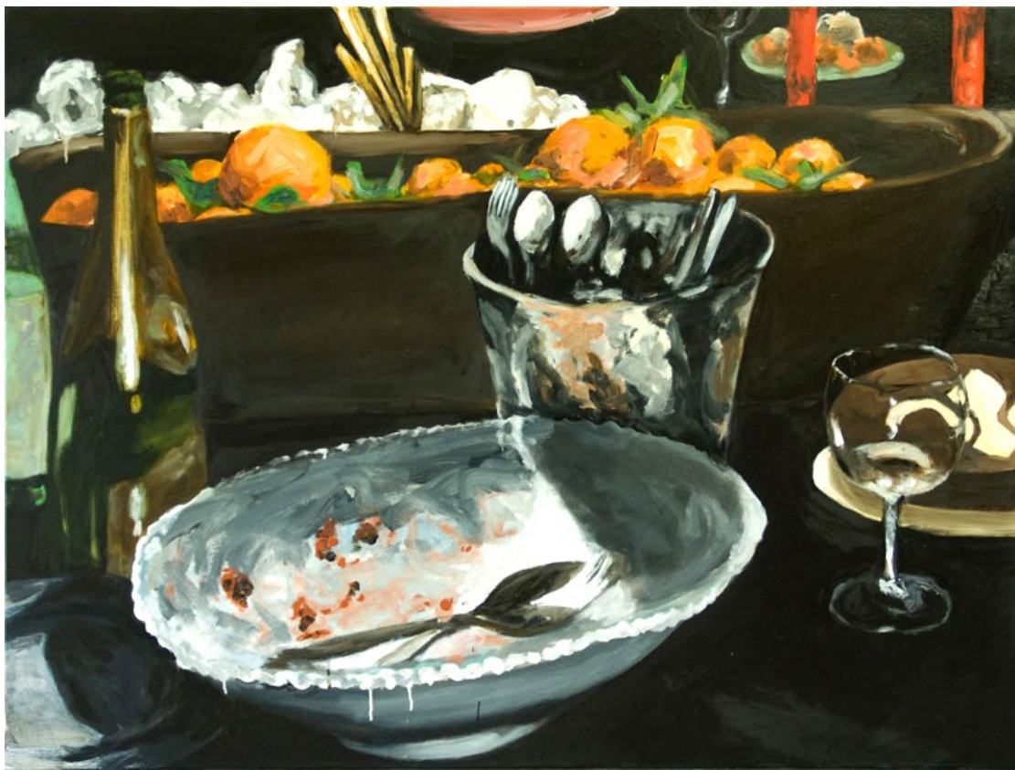
Martin Bruneau, Détails n°1 , 2010 Huile sur toile, 97 x 130 cm

“La peinture, c’est l’occasion que la société m’offre de ne pas être sage tout en essayant d’être intelligent. J’ai toujours conçu la peinture comme un outil pour comprendre le monde, mais très vite j’ai réalisé que celui-ci demeure insaisissable. J’imagine que c’est dans l’obstination et la persévérance à cette tâche irréalisable que peut se produire l’œuvre.”