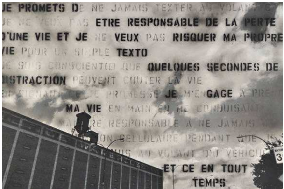
La bêtise est humaine