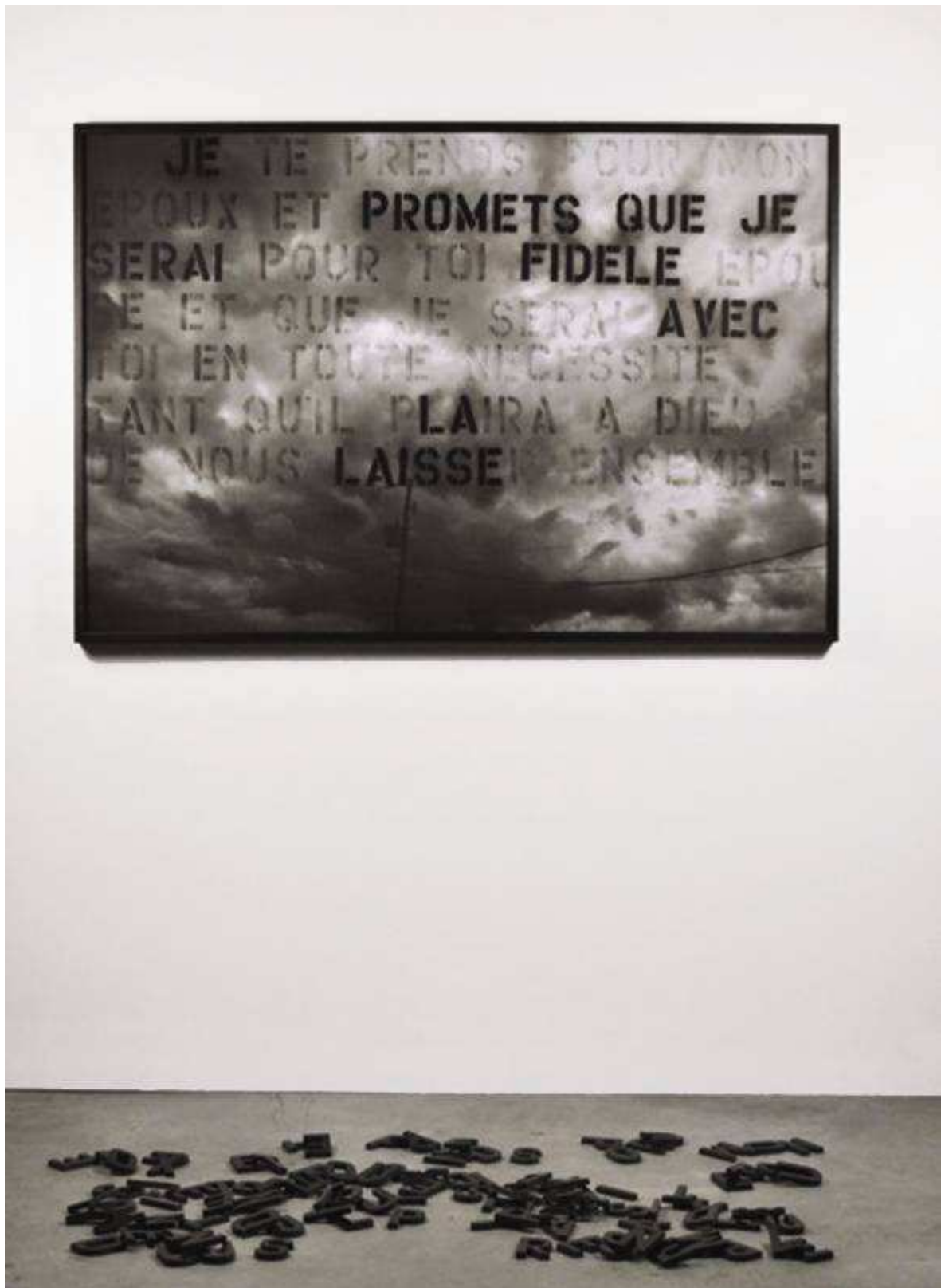
Sept ans de mariage plus tard , installation, 2011 Photographie, Impression numérique noir et blanc et pastel sec Archival Prints, lettres granit noir 104 x 153 cm, 1/5 + E/A