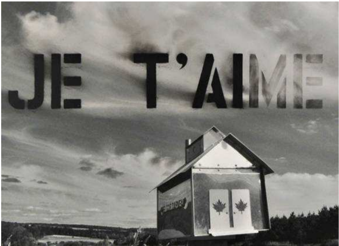
Aimer c'est donner quelque chose que l'on n'a pas à quelqu'un qui n'en veut pas* ou Me, Myself and I", 2011 (*citation de J. Lacan)

Photographie, Impression numérique noir et blanc et pastel sec, Archival Prints 67 x 105 cm, 1/5 + E/A