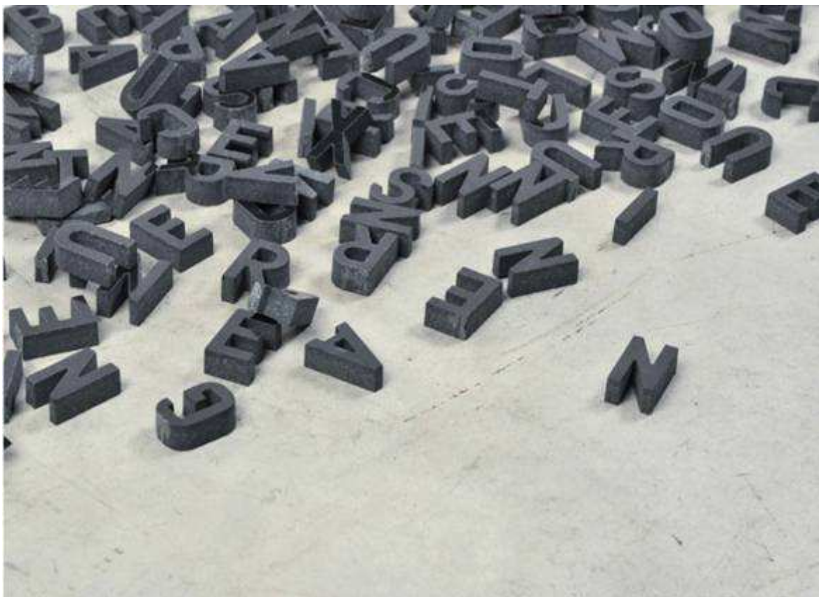
La bêtise est humaine, détail installation