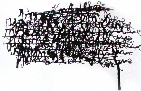
Isabelle Lévénez, I am still alive , 2009 Encre aquarelle et pastel sur papier, 41 x 58 cm