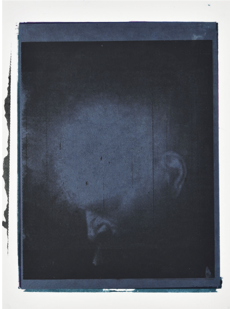
Aurore PALLET Sans titre , 2019 Huile sur papier, 32 x 24 cm