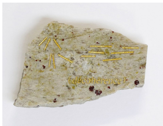
Aurore Pallet Décohérence , 2019 Granit gravé et or, 9 x 13 cm

Des rues désertes. Aux carrefours clignotent encore des feux de circulation. Les vitrines des magasins, pillées, vidées, ont déversé leurs bris de verre sur la chaussée où gisent des chiens affamés. Dans une maison abandonnée grésille un poste de télévision laissé allumé tandis qu'au loin, terrible et menaçante, la montagne tremble et fume, annonçant le pire.