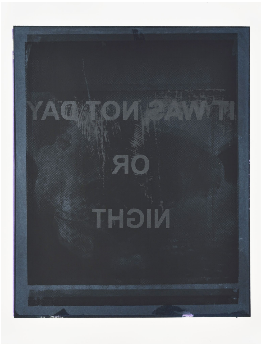
Aurore PALLET Sans titre , 2019 Huile sur papier, 65 x 50 cm