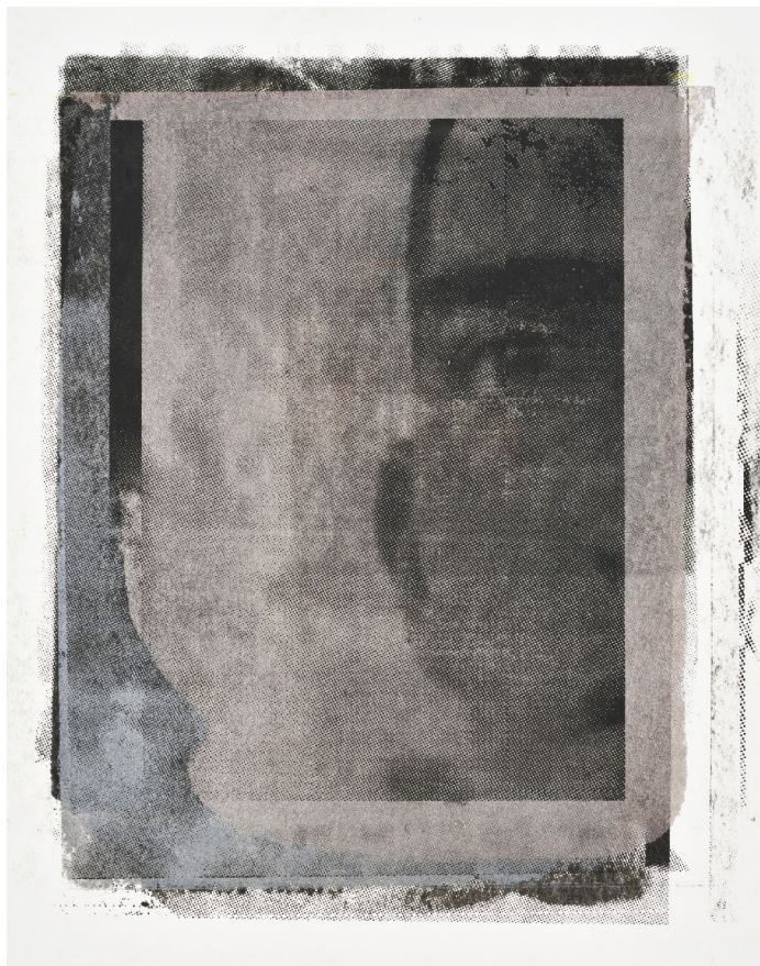
Aurore PALLET Sans titre , 2019 Huile sur papier, 32 x 24 cm