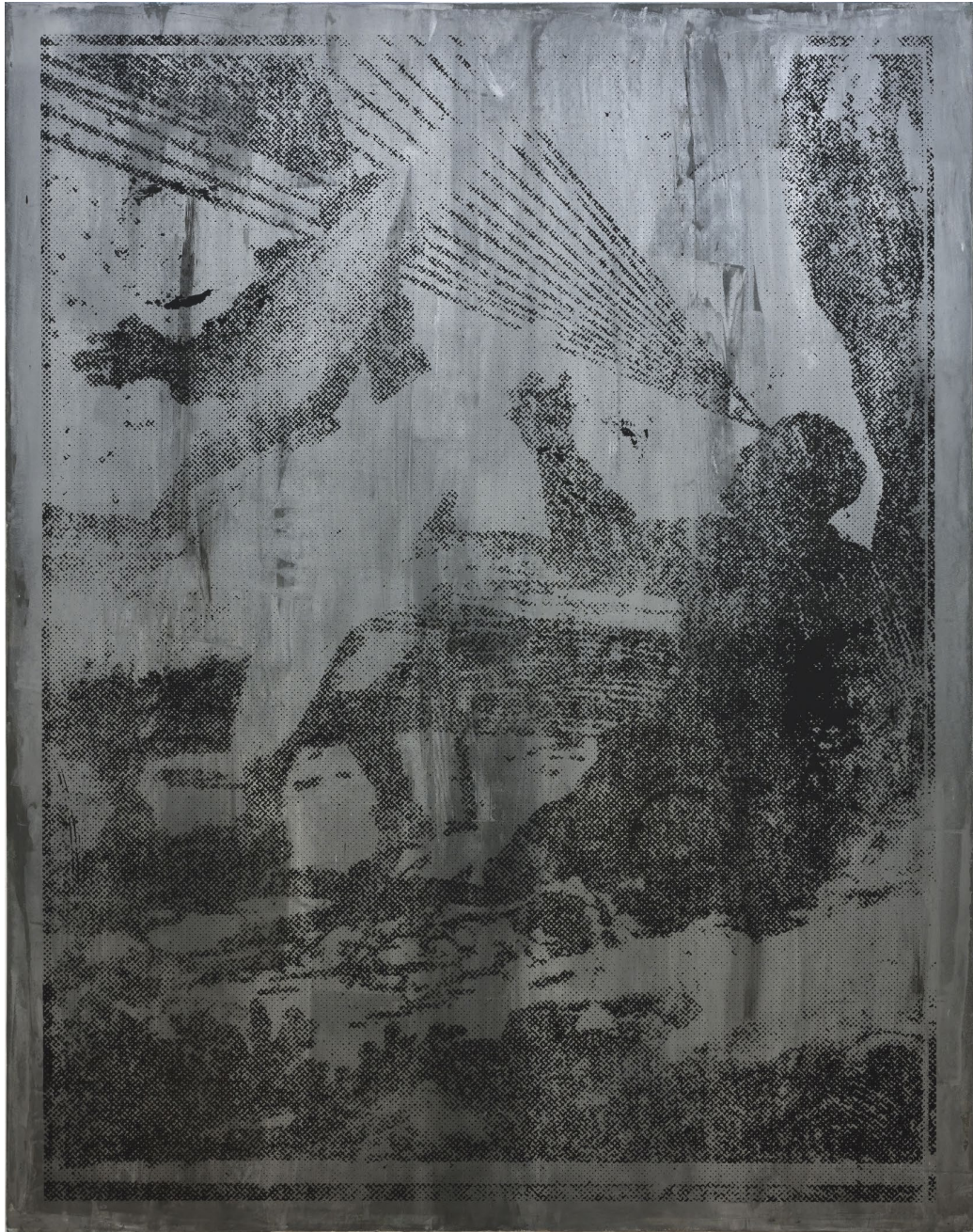
Aurore PALLET Sans titre , 2019 Huile sur papier marouflé sur toile 190 x 150 cm