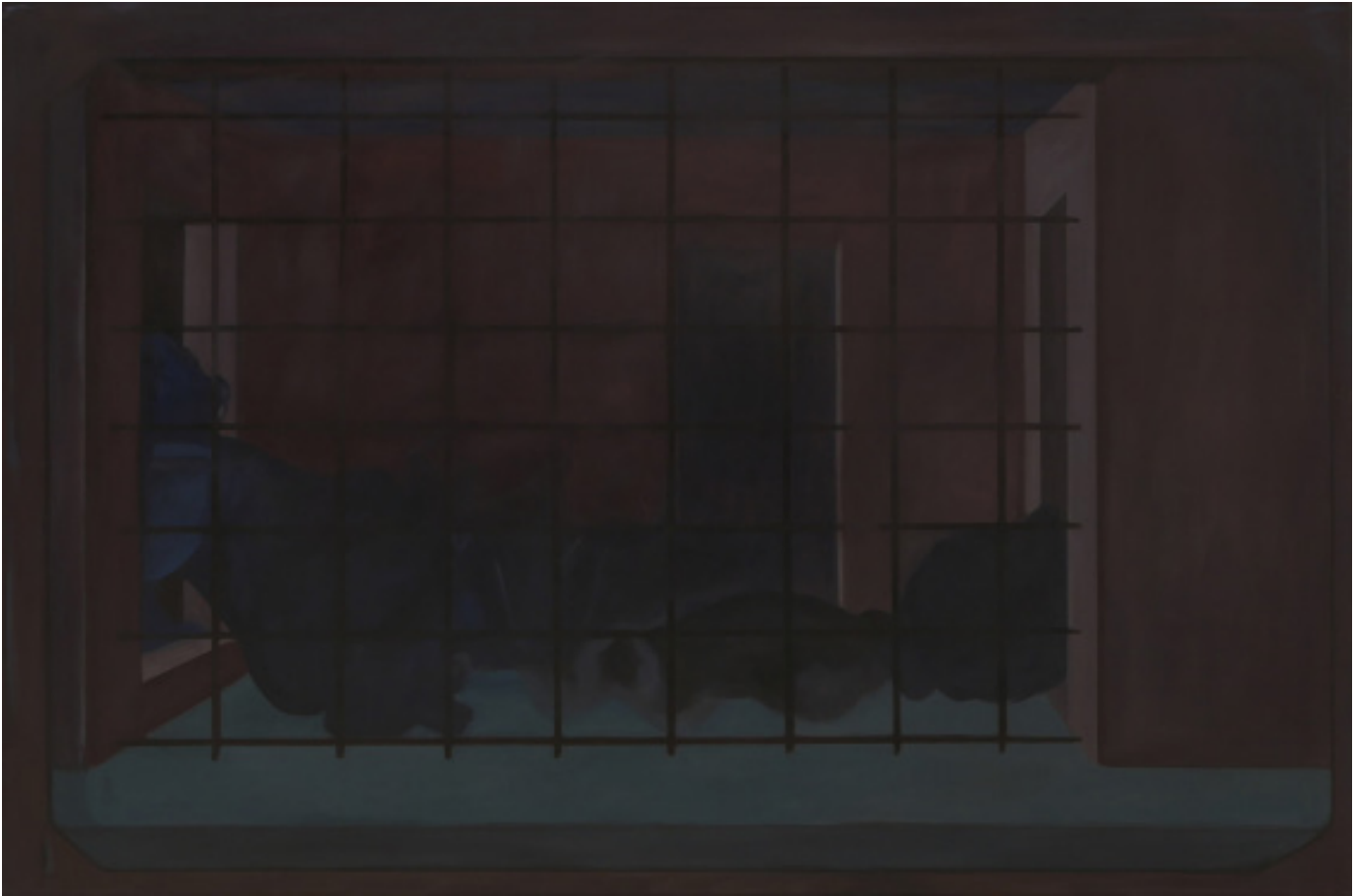
Aurore Pallet Les forces en présence 3 , 2017 Huile sur bois 100 x 150 cm