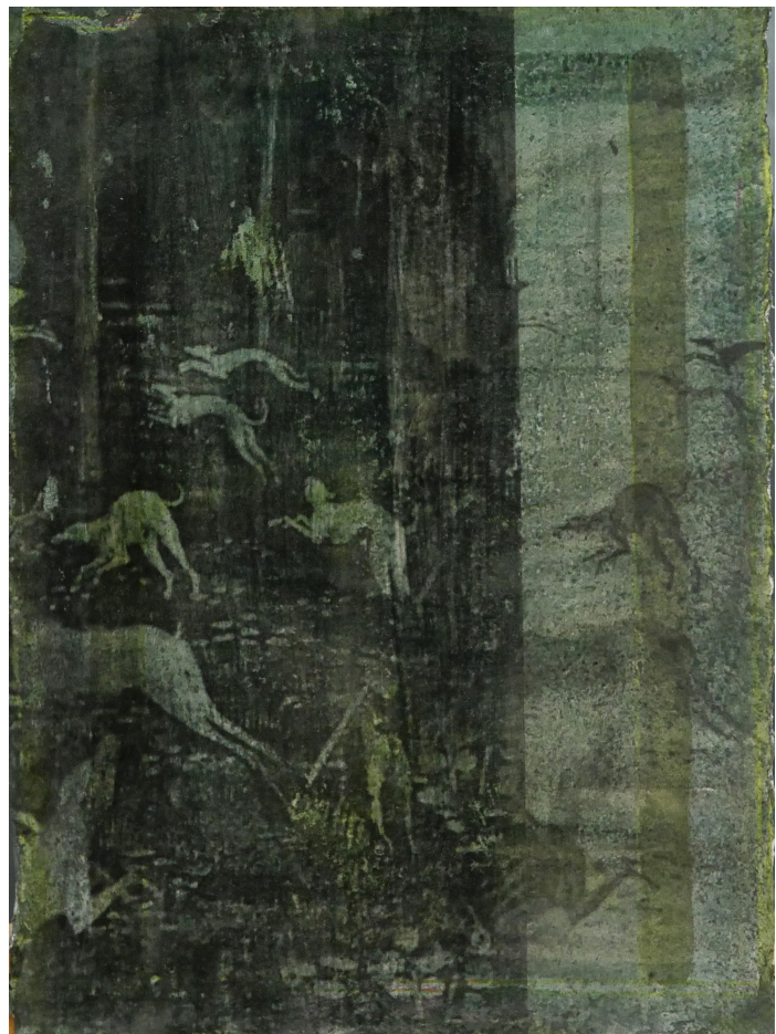
Aurore Pallet Sans titre , 2017 Transfert et huile sur papier 21 x 15 cm