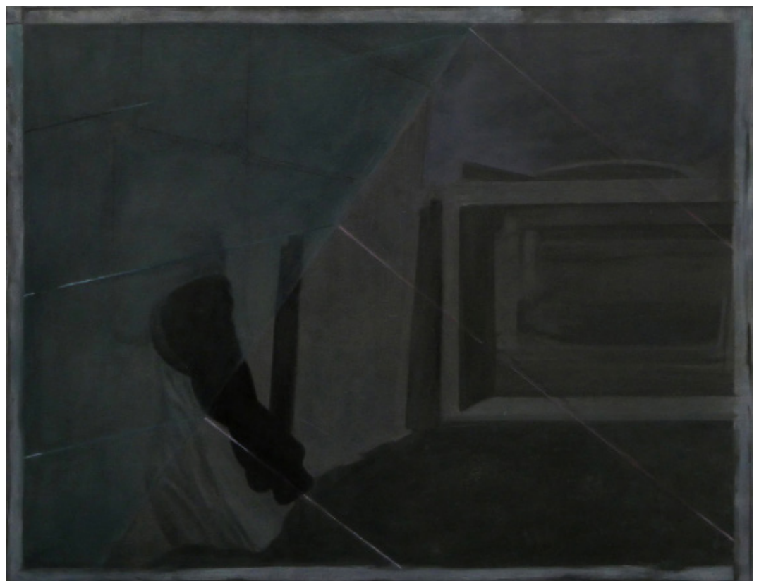
Aurore Pallet Les forces en présence 7 2017 Huile sur bois 51 x 40 cm