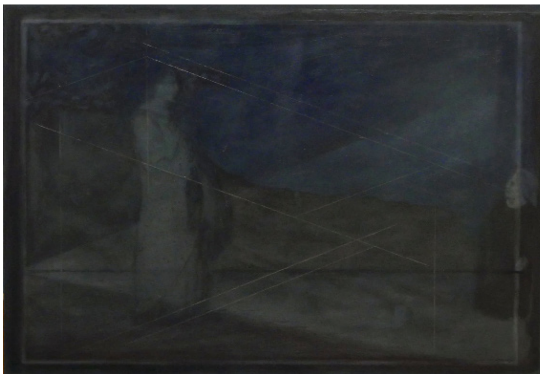
Aurore Pallet Les forces en présence 5 , 2017 Huile sur bois 28 x 40 cm