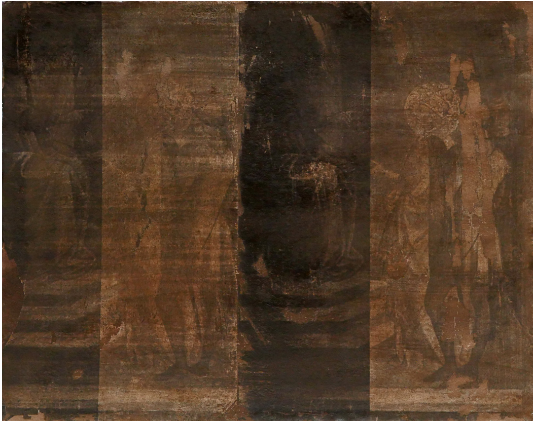
Aurore Pallet Sans titre , 2017 Transfert et huile sur papier 29 x 36,5 cm