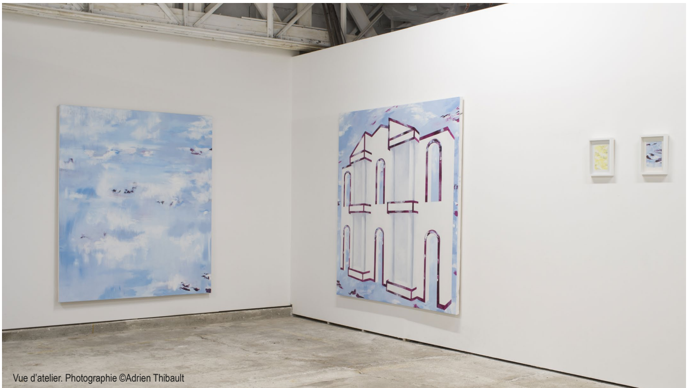
Vue d'atelier.