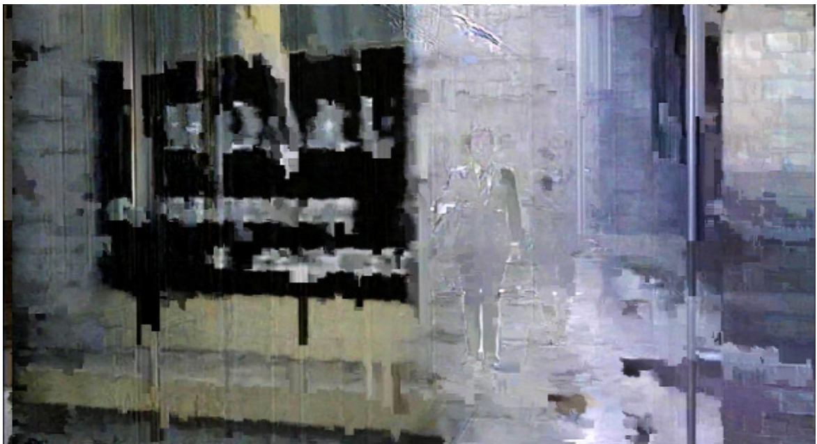
Éric Rondépierre, DSL 18 , 2011, 50 x 90 cm