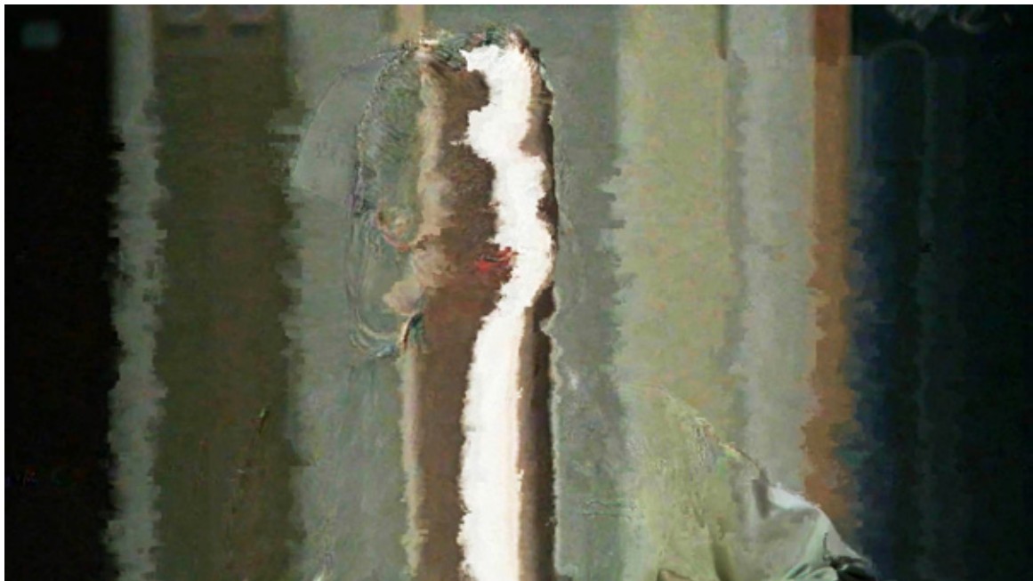
Éric Rondepierre, DSL 28 , 2015, 50 x 90 cm