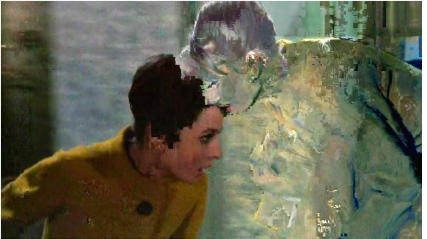
Éric Rondepierre, DSL 17 , 2011, 50 x 90 cm