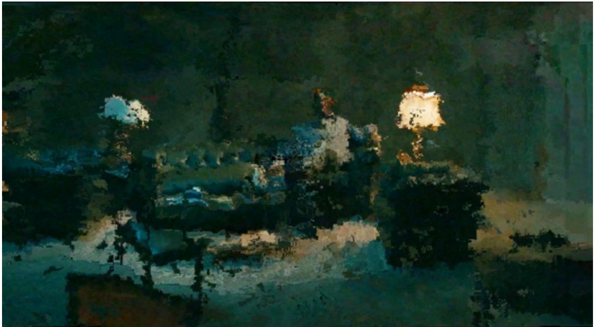
Éric Rondepierre, DSL 24 , 2015, 70 x 126 cm