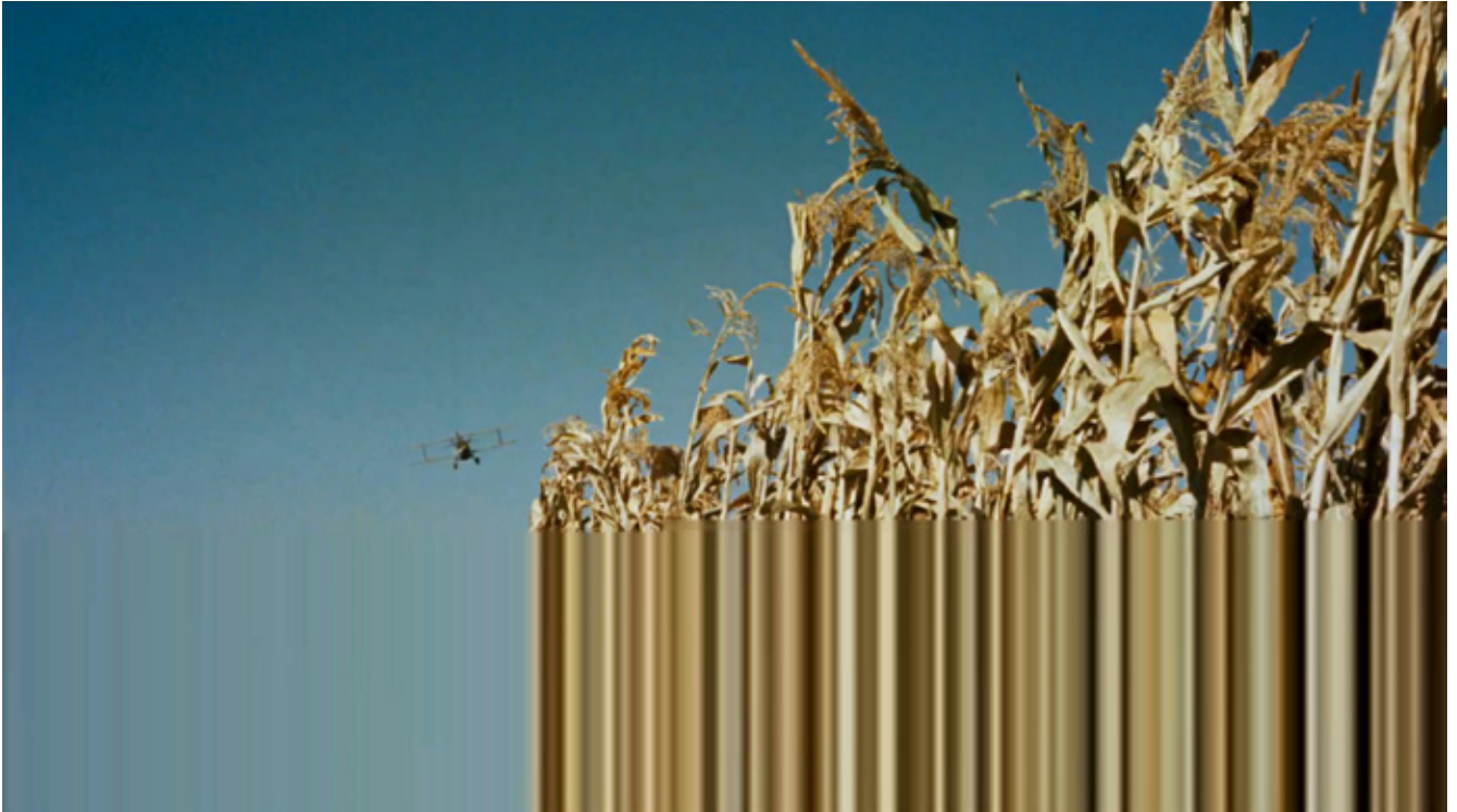
Éric Rondepierre, DSL 27 , 2015, 50 x 90 cm

G A L E R I E I S A B E L L E G O U N O D