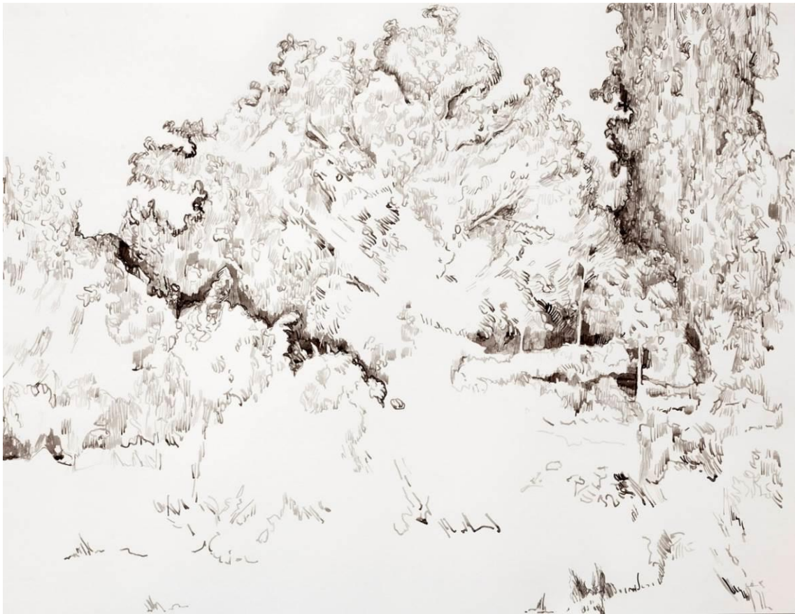
Jardin de l'antérieur 1 , 2013-2014, plume et encre de chine sur papier, 50 x 65 cm