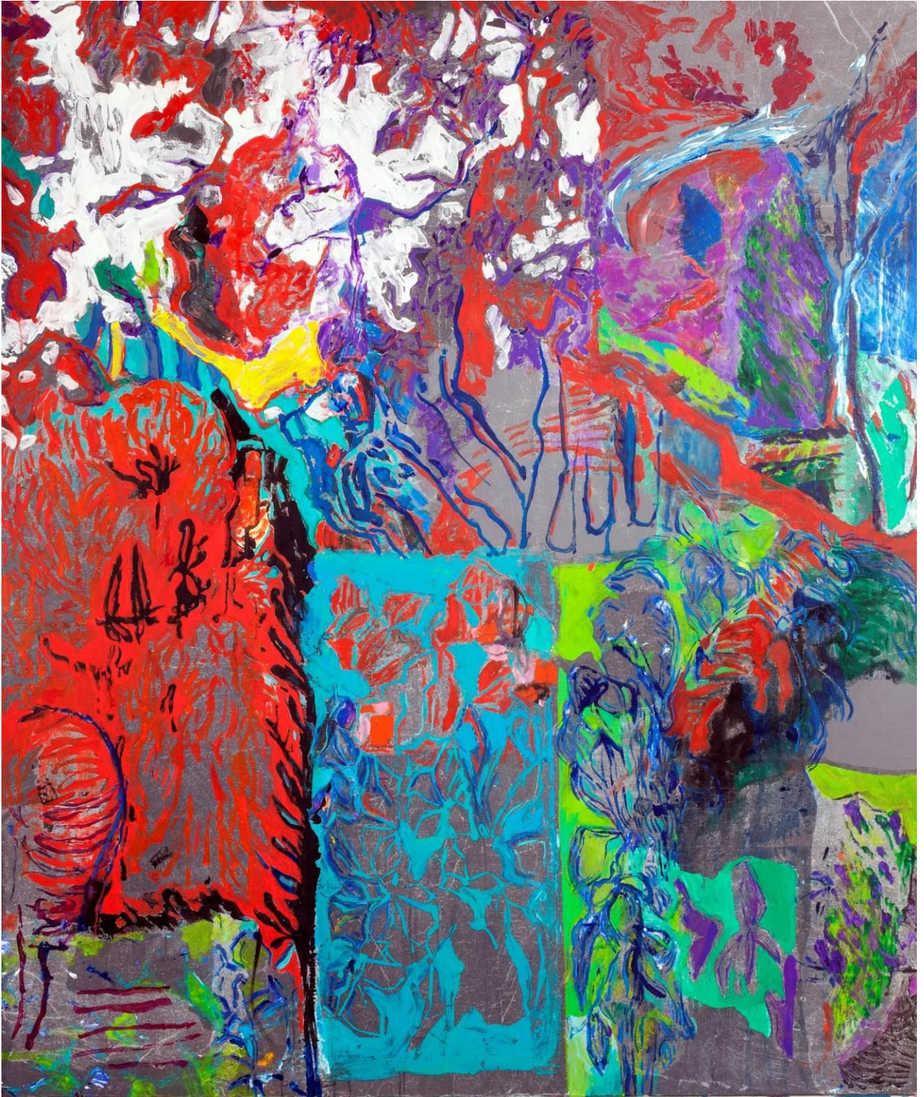
Claire-voie , 2013-2014, technique mixte sur toile, 180 x 150 cm