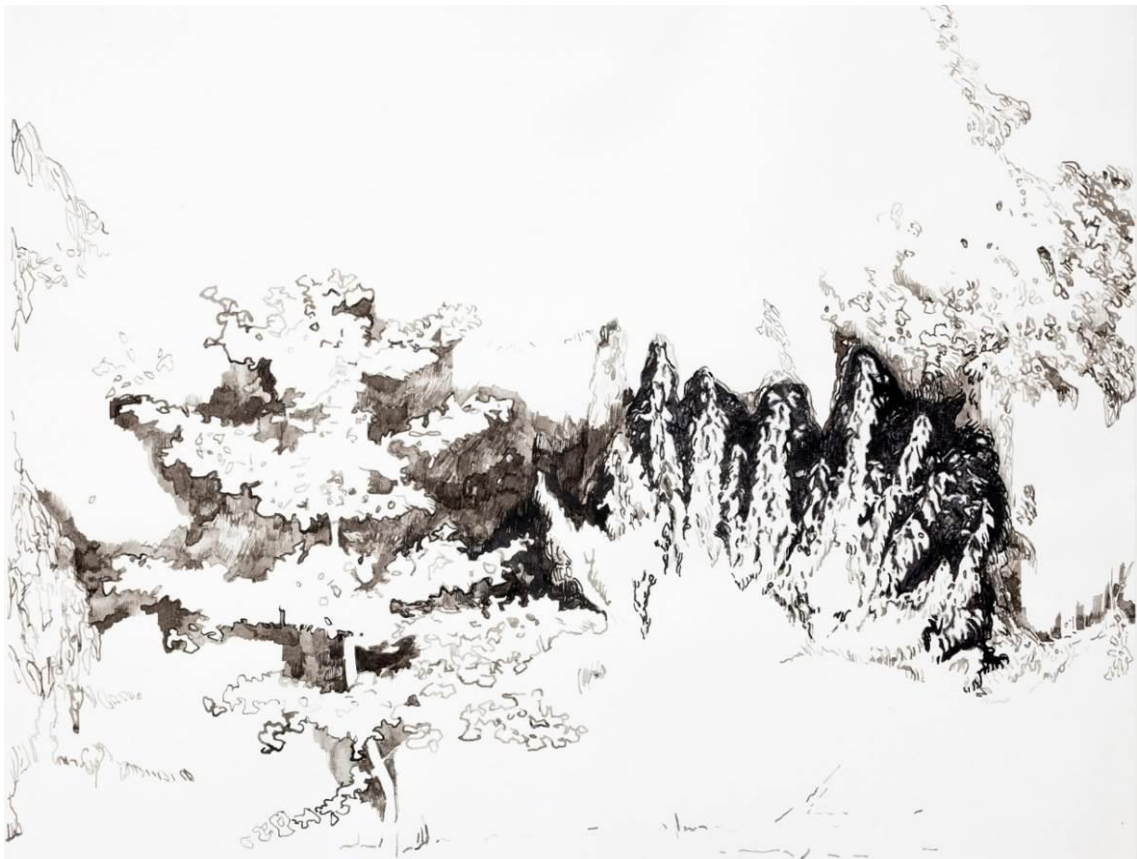
Jardin de l'antérieur 2 , 2013-2014, plume et encre de chine sur papier, 50 x 65 cm