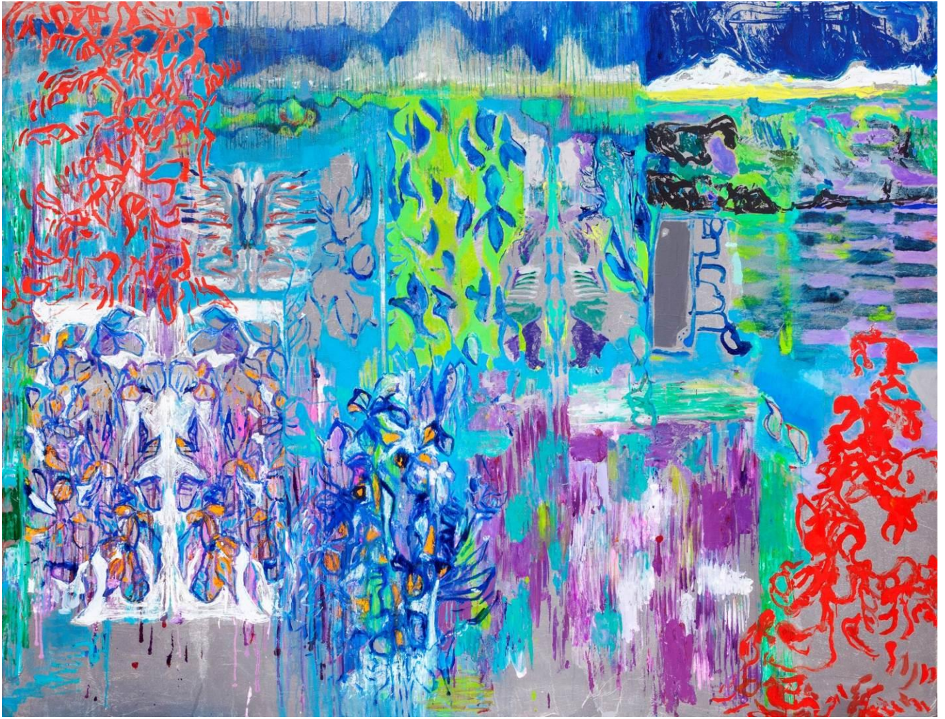
Blue velvet , 2013-2014, technique mixte sur toile, 185 x 240 cm