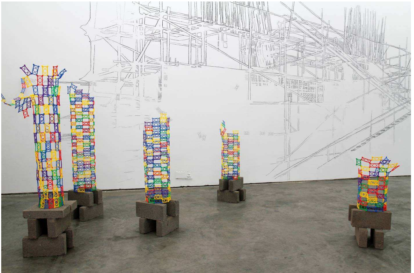
Vue de l'exposition Périphériques et tangentes, 2013, Thousand Plateaus Art gallery, Chengdu, Chine