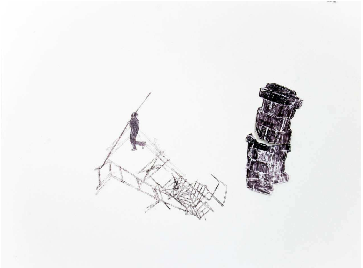
Sans-titre , 2014, technique mixte sur papier, 46 x 61 cm