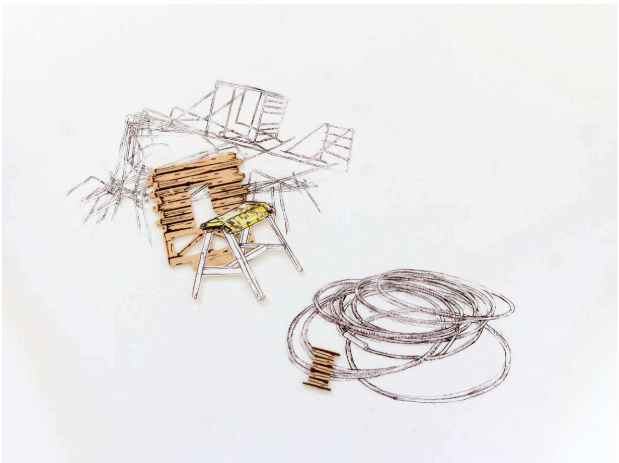
Sans-titre , 2014, technique mixte sur papier, 46 x 61 cm