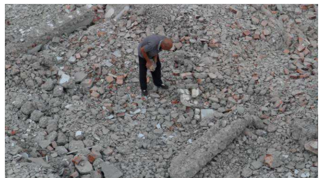
Surface , 2013, vidéo HD, 2'30 en boucle