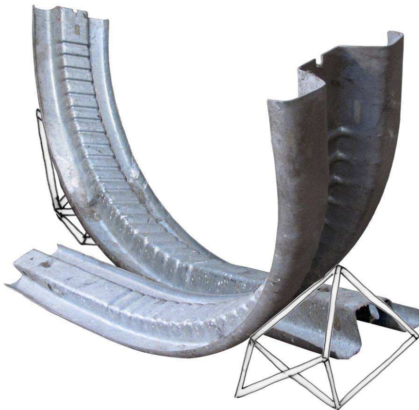
Sans-titre , 2014, glissières de sécurité et structure en acier, 180 x 150 cm