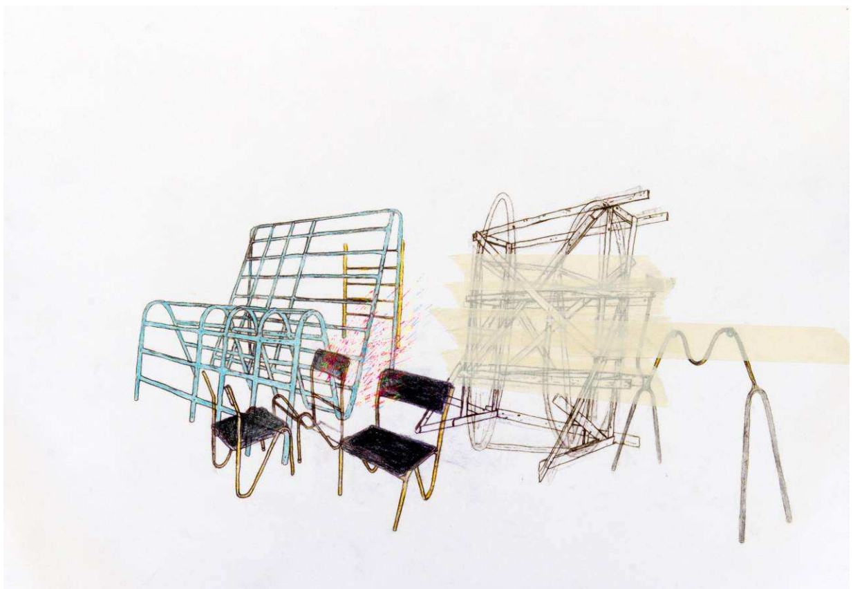
Sans-titre , 2014, technique mixte sur papier, 42,2 x 59 cm