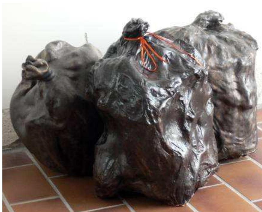
Florent LAMOUROUX Contradiction , 2010 Céramique, environ 30 x 40 cm