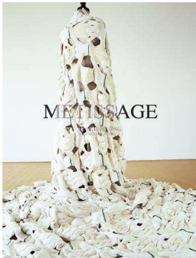
Lucie DUVAL Métissage , 2006 Photographie numérique-impression pigments, contrecollée sur Dibon, 130 x 95 cm