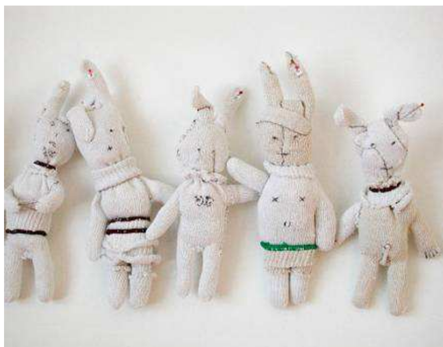
Lapins à adopter , 2008 Gants de travailleurs en coton et polyester, Hauteur 30 cm environ