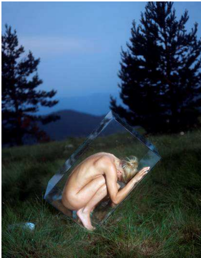
Antea ARIZANOVIC Walk in a circle 1, 2007 Photographie, tirage lambda, 100 x 77 cm 1/5