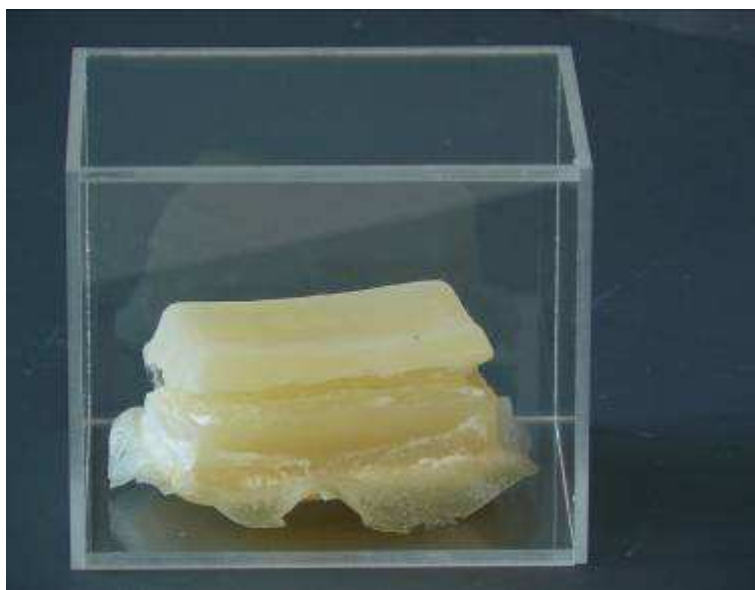
Jérémy LAFFON Productivity Run Away , 2009 Savons de Marseille, eau, boîte de plexiglas, dimensions variables.