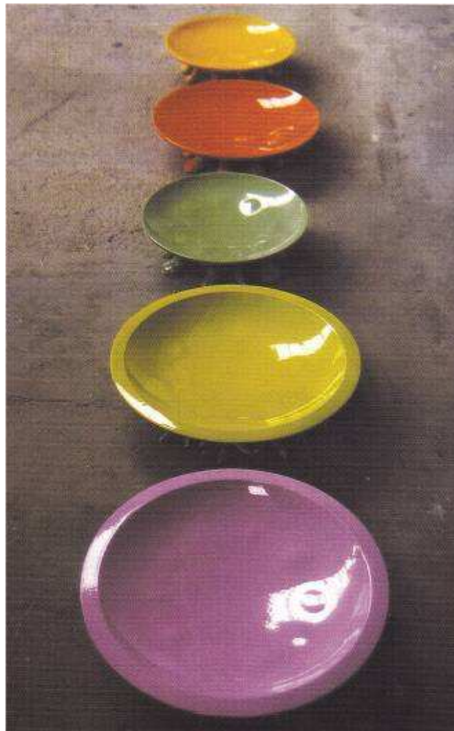
Michaële-Andréa SCHATT Plats à pattes, 2010, céramique, diam. 50 cm